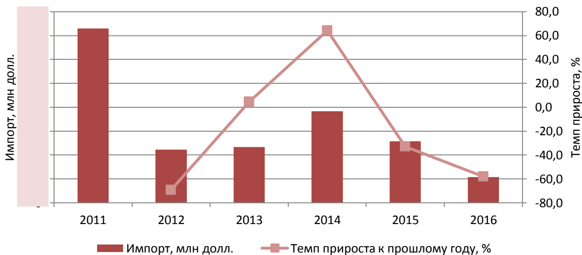
Диаграмма 4. Объем и динамика импорта в денежном выражении, 2011-2016 гг.

В 2011 г. объем импорта картофеля составил ... тыс. т. Это значение показателя значительно превысило среднегодовые показатели, что обусловлено большим недобором урожая 2010 г. В 2014 г. также наблюдался значительный рост импортных поставок картофеля на территорию Российской Федерации (на ...% по отношению к 2013 г.) в связи с относительно низким объемом производства картофеля в 2013 г. Объем импорта картофеля в 2014 г. составил ... тыс. т.