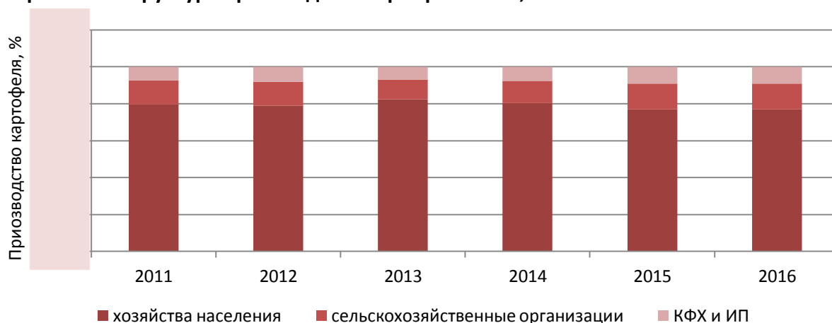
Диаграмма 3. Структура производства картофеля в РФ, 2011-2016 гг.

Следует отметить, что производство картофеля в России происходит не централизованно 77-82% всей продукции производят хозяйства населения. На долю сельскохозяйственных организаций приходится ... % от всего объема производства и ... % производят КФХ и ИП. Благодаря стимулированию агропромышленных предприятий со стороны государства в 2015-2016 гг. промышленный объем производства картофеля увеличился до ...%.