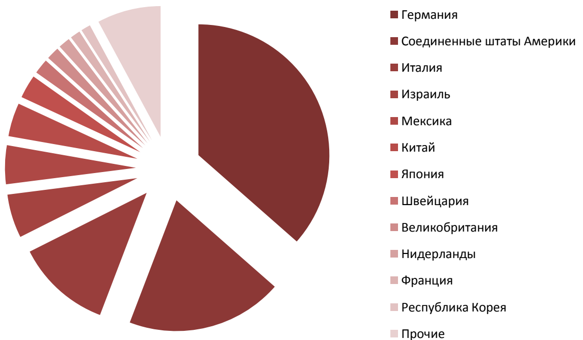
Диаграмма 2. Структура импорта по странам-отправителям в 2016 г., %