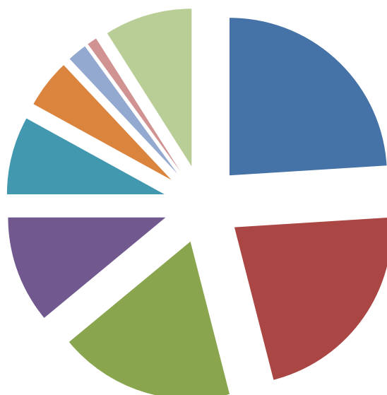
Диаграмма 3. Доли крупных конкурентов на рынке одноразовых медицинских лезвий, %