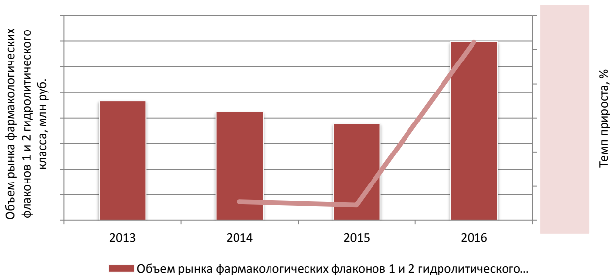
Диаграмма 6. Динамика объёма рынка фармакологических флаконов 1 и 2 гидролитического класса в РФ (2013 – 2016 гг.), млн руб.

Рассмотрим динамику объёма и емкости рынка.